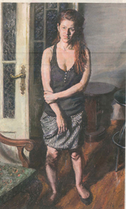
Η Αγγελική με γρήγορο φως. Έργο του Στέφανου Δασκαλάκη, που παρουσιάζεται στο Μουσείο Μπενάκη στην οδό Κουμψάρι.

τογραφίες ατόμων που κάνουν αυτή τη δουλειά. Κάπως έτσι γίνεται απόβλεπτες συναντήσεις, μέσα από τις οποίες ο ζωγράφος, που είναι κλεισμένος σε ένα καρόλαιο, ομιλείται τι συμβαίνει έξω. Καταβαρύνει τον κόσμο, να, όπως η κρίση που καταγράφει την ελληνική κοινωνία σήμερα: κάνει όλο-όλο του την αφήγηση του κορμού του. Και αυτή οι άνθρωποι, οι τόσο καθιερωμένοι, γίνονται περιτριγυρισμένοι στο έργο μου, γίνονται αρεχθόμενοι μορφή».