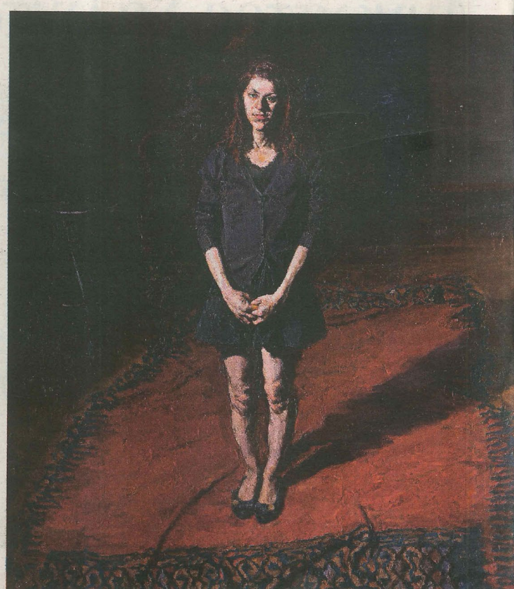
«Ορθια φιγούρα», 2011